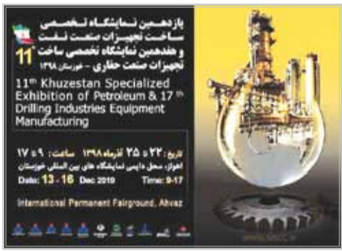
یازدهمین و هفدهمین نمایشگاه مشترک ساخت تجهیزات صنعت نفت و حفاری خوزستان در محل دائمی نمایشگاه های استان خوزستان در اهواز آغاز به کار کرد.

بر این اساس ۲۶۰ شرکت فعال در عرصه ساخت قطعات و تجهیزات صنعت نفت و حفاری از استان های خوزستان، تهران، فارس، اصفهان، خراسان رضوی، مرکزی، آذربایجان شرقی، چهارمحال و بختیاری و کرمانشاه در این رویداد اقتصادی مشارکت دارند.