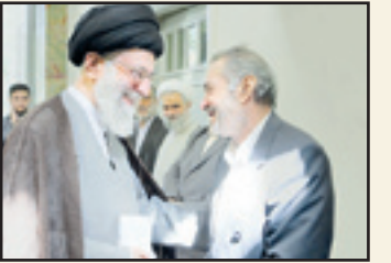
استادسیداکبر پرورش در واپسین دیدار با رهبرمفلم انقلاب

مرتضی نجفی قدسی است که سالیان طولانی، با آن بزرگ مراودت داشته و از خرم بینش و منش او، بهره‌ها جسته است. وی در دیباچه این مجموعه، در باب موضوع و محتوای آن چنین آورده است: «استاد پرورش انسان بسیار بزرگی بود که ابعاد وجودی او به آسانی قابل تبیین نیست. ایشان از پیشگامان نهضت انقلاب اسلامی به شمار می‌آمد و با بسیاری از بزرگان این نهضت همانند شهیدبهشتی، شهیدمطهری، شهیدجایی، شهیدباهنر، رهبری معظم انقلاب اسلامی حضرت آیت‌الله‌العظمی خامنه‌ای– مدظله‌العالی– و حضرت آیت‌الله‌هاشمی‌رفسنجانی و بسیاری دیگر از اعظام، همچون آیت‌الله‌ مهدوی‌کنی، مرحوم حبیب‌الله عسکری‌مولادی و دیگران همراه و همگام بود. به حق باید گفت که ایشان یکی از استوانه‌های انقلاب اسلامی بود و به‌خصوص در منطقه اصفهان که زادگاه ایشان بود، یکی از سه رکن اصلی انقلاب، پس از مرحوم آیت‌الله سیدحسین خادمی و آیت‌الله سیدجلال‌الدین طاهری محسوب می‌شد. شرح مبارزات و سخنرانی‌های انقلابی و کوبنده و روشنگرانه ایشان در طول نهضت انقلاب اسلامی مایه دلگرمی تمام انقلابیون اصفهان بود و بسیاری از شهیدی‌گرانتقد انقلاب از شاگردان و دست‌پروردگان فکری ایشان بودند، ولی همه اینها بیانگر عظمت وجودی ایشان نیست و برای ما که از دوران کودکی ایشان را دریافته و تا آخر در بسیاری از سفرها و حضرها، خلوت‌ها و جلوت‌ها و در عموم و بیشتر از خواص، ایشان را از نزدیک دیده‌ایم، آنچه برایمان بیشتر از همه جلوه گرمی می‌کند، عظمت معنوی ایشان است که به حق و انصاف انسانی عارف و عاشق پروردگار و متخب اهل‌بیت(ع) بود.