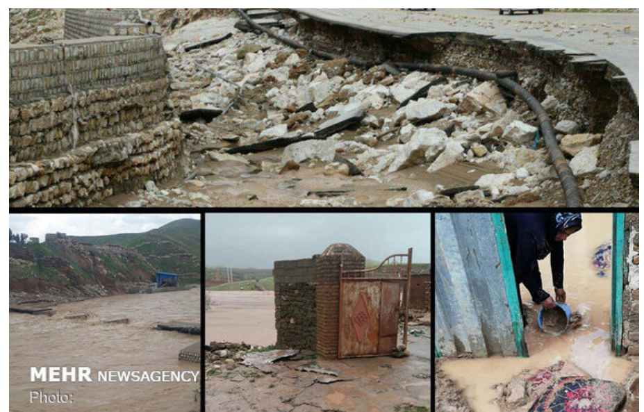
واحد مسکن شهری و روستایی، ساخت ۱۴۲ واحد تجاری، تعمیر هزار و ۳۰۴ واحد تجاری بوده است.

واحد مسکن شهری و روستایی، ساخت ۱۴۲ واحد تجاری، تعمیر هزار و ۳۰۴ واحد تجاری بوده است. از پرداخت مبلغ ۸۷ میلیارد تومان تسهیلات بلاعوض معیشتی به تعداد ۱۸ هزار و ۲۱۵ متقاضی واحد شرایط، توزیع ۸ هزار فقره پک لوازم خانگی در استان خبر داد.