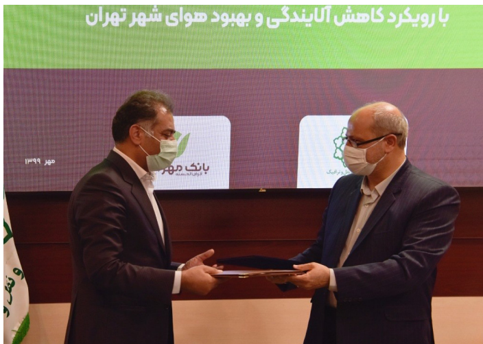
با رویکرد کاهش آلاینده‌گی و بهبود هوای شهر تهران

بزرگترین بانک قرض الحسنه کشور برای نوسازی وسایل حمل و نقل شهر تهران پیشگام شد