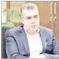
معاون وزیر اقتصاد گفت: در حال حاضر حجم بدهی‌های خارجی کشور فوق‌العاده ناچیزو