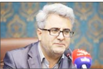
کل‌سالی بماند بهتر و اقتصادی‌تر است تا رسیدن به چند درصد

از ظرفیتش تکمیل شود؟ آژانس‌های گردشگری در دست است که سال سختی را سپری کرده‌اند. اما جطور برخی از آن‌ها در مسیر تکیه بر جواز چارتر می‌کنند تا هزینه‌ها به صرفه شود. اما برای مسیر داخلی نمی‌توانند این کار را انجام دهند. به‌نظر بخش خصوصی می‌تواند راه‌محدوده اختیارات خود، بخشی از هزینه‌های سفر را کنترل کند تا مردم سازماندهی شده‌تر سفر کنند و درآمدش را نصیب بخش خصوصی و تاسیسات گردشگری شود. وی در پاسخ به اینکه اگر دغدغه‌گرانی سفر و مسافرت‌های بدون سازماندهی و مخاطره‌آمیز در شرایط کرونا وجود دارد، چربا بخش دولتی در این باره اقدام نمی‌کند تا هم هزینه‌ها پایین آید و هم سفر مدیریت شود؟ گفت: بسیار مایلم که از مالیات و عوارض در بخش گردشگری کاسته شود، چون می‌دانیم اثر مستقیم آن به مردم می‌رسد.