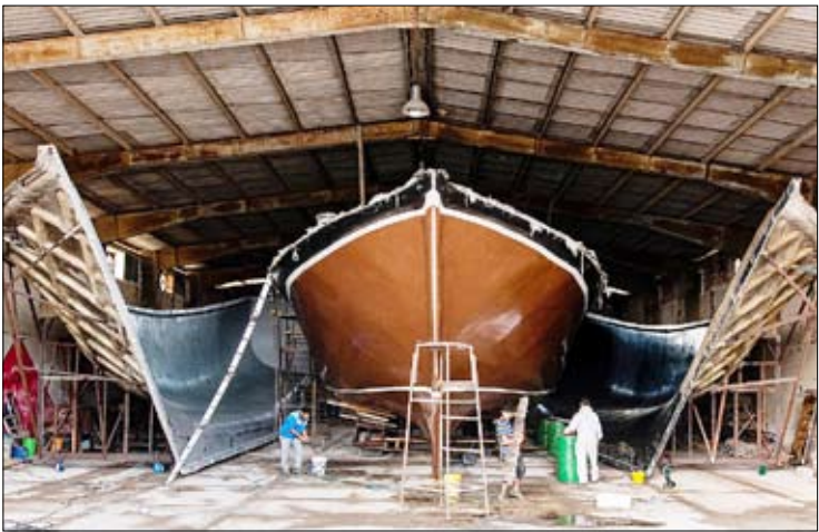
قاب روز ساخت لنج فایبر گلاس - بوشهر

این نامه اخلاق حرفه‌ای «تجارت» را در سایت روزنامه ببینید.