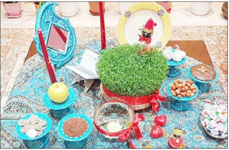
قالب روز صدای پای عید