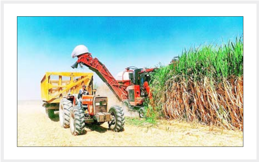
تجهیزات تخصصی برای افزایش بهره‌وری در نیشکر

در راستای توسعه پایدار صنعت نیشکر با هدف تکمیل زنجیره صنایع جانبی و ایجاد ارزش افزوده منقد شد و بر اساس آن، سازمان تحقیقات آموزش و ترویج کشاورزی آمادگی خود را برای کل‌گیزی دانش و توان محققان خود برای افزایش بهره‌وری صنعت نیشکر اعلام کردند.