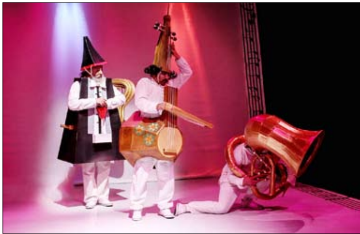
نمایش موزیکال جنگ و صلح