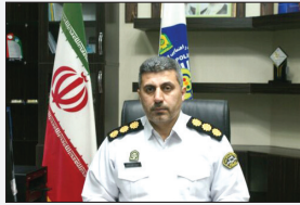
رئیس پلیس راهور استان گلستان

اجرا شد، افزود: در این مرحله ضمن اعمال قانون ۲۰ فقره از تخلف های مذکور، هفت دستگاه خودرو به علت داشتن آلودگی صوتی، از گزوز غیر استاندارد و انجام حرکات مخاطره آمیز توقیف و به پارکینگ منتقل شدند. وی با تأکید بر اینکه اجرای چنین طرح هایی به منظور برقراری نظم و امنیت ترافیکی انجام می شود، گفت: از مردم استان تقاضا داریم ضمن رعایت قوانین و مقررات رهنمایی و رانندگی با فرزندان خود در نیروی انتظامی همکاری لازم را داشته باشند.