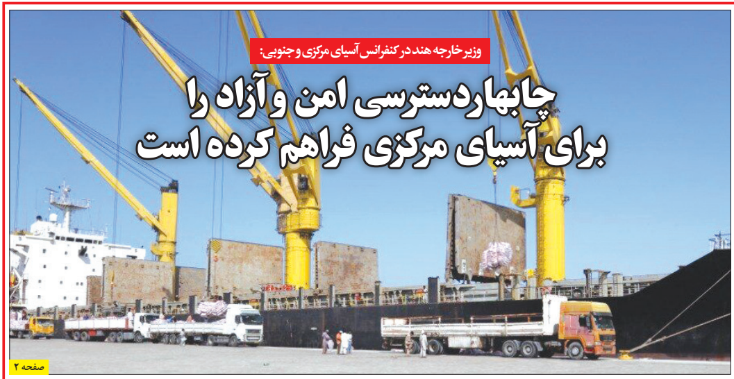
وزیر خارجه هند در کنفرانس آسیای مرکزی و جنوبی: