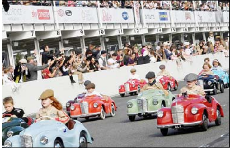
قاب روز مسابقه خودروهای بدالی کودکان در انگلستان