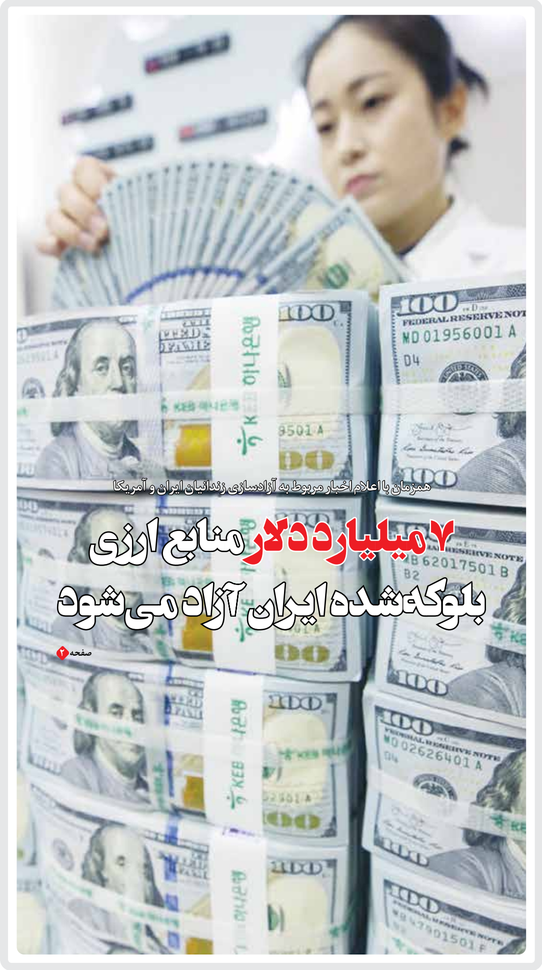
همزمان با اعلام اخبار مربوط به آزادسازی زندانیان ایران و آمریکا