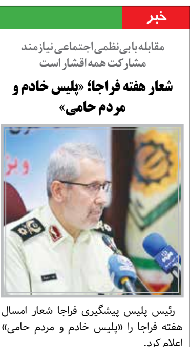
رئیس پلیس پیشگیری فراجا شعار امسال هفته فراجا با «پلیس خادم و مردم حامی» اعلام کرد.

به گزارش ایسنا، سردار مهدی معصوم بیگی در دهمین جلسه هماهنگی برنامه‌های پلیس پیشگیری برای هفته فراجا حول ماه ربیع الاول، ماه جشن و سرور اهل البیت(ع) را تبریک گفت.