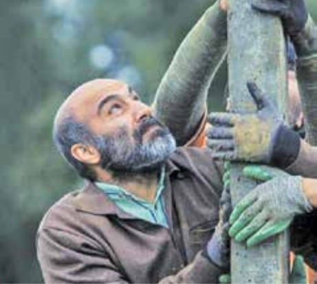
جنگ جهانی سوم