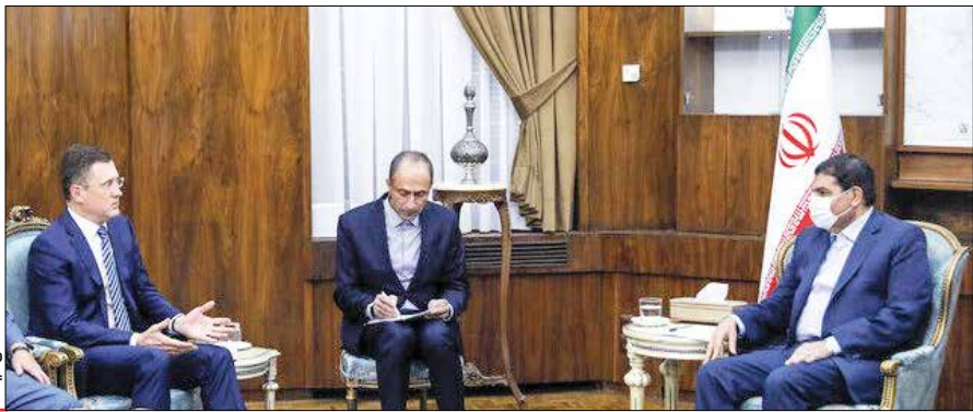
دیدار محمد مخبر، معاون اول رئیس‌جمهور با الکساندر نووک، معاون نخست‌وزیر روسیه

دومین همایش اقتصادی خزر در تاریخ ۱۳ و ۱۴ مهرماه سال جاری در شهر مسکو پایتخت روسیه برگزار می‌شود. کشورهای روسیه، ترکمنستان، قزاقستان، آذربایجان و ایران به عنوان پنج همسایه در موضوعات نفت و گاز، انرژی، حمل و نقل، علمی، محیط زیست و کشاورزی به طور دو جانبه و چند جانبه با