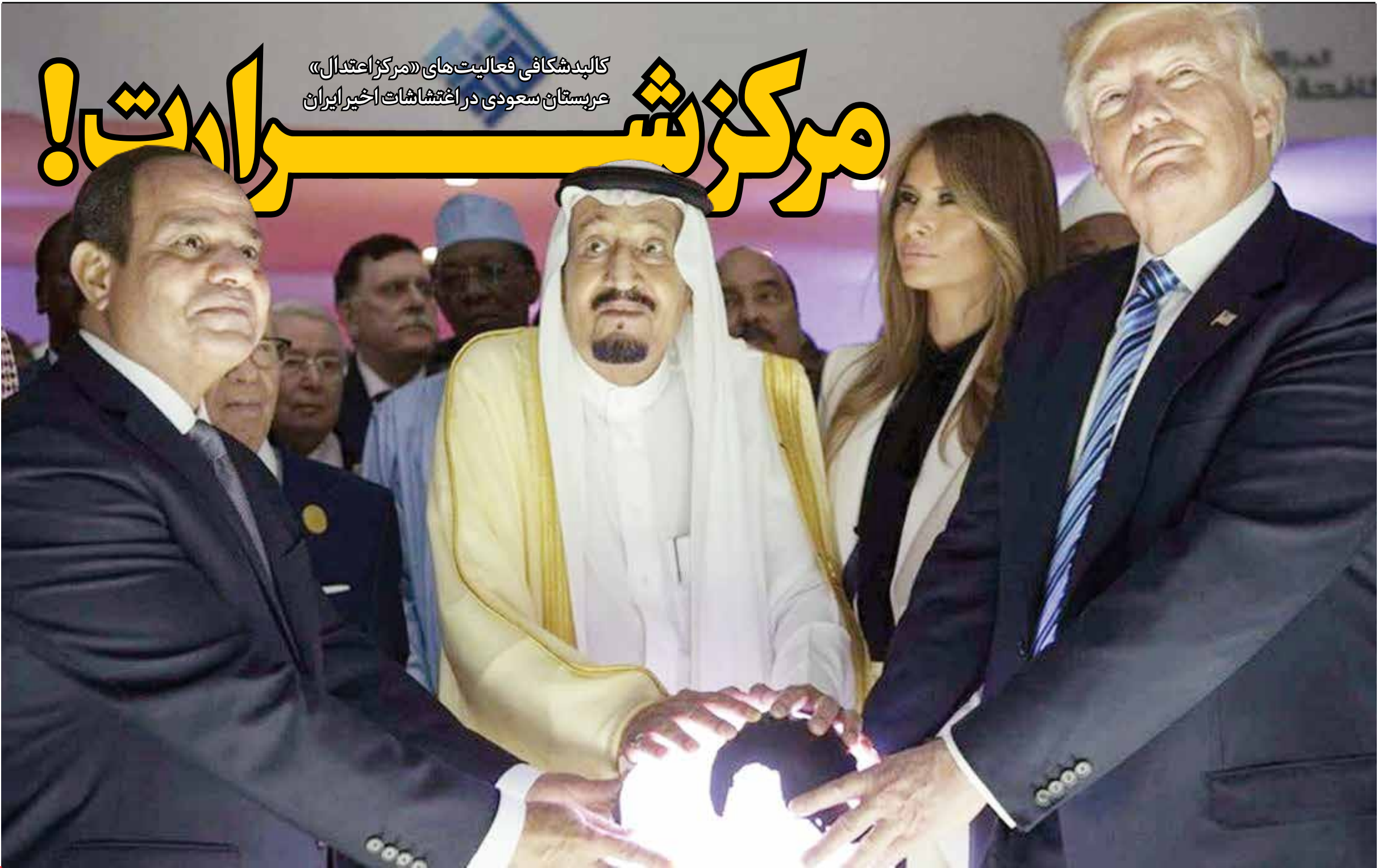
افتتاح مرکز اعتدال در ۲۱ مه سال ۲۰۱۷ - رئیس جمهور آمریکا، در کنار پادشاه سعودی و رئیس جمهور مصر