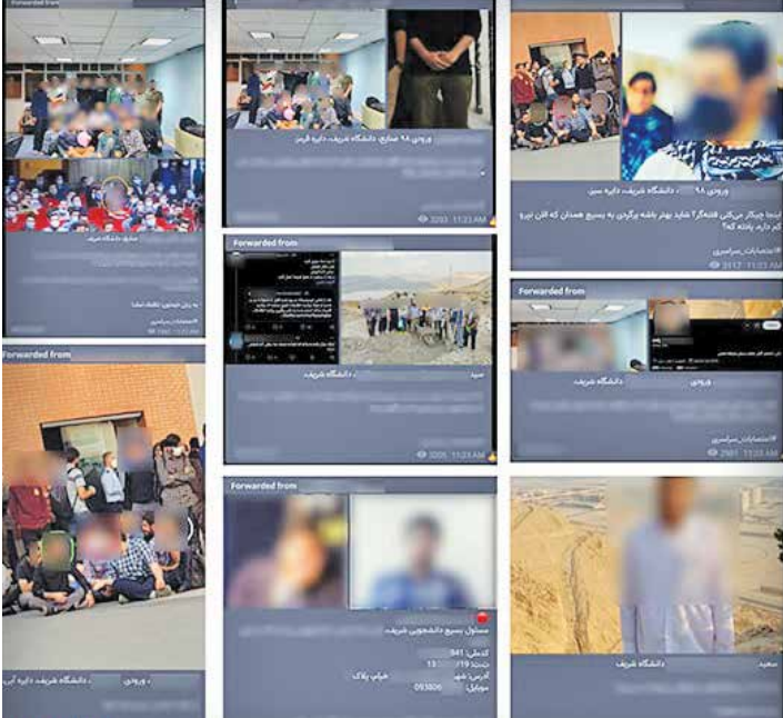
انتشار تصاویر و مشخصات خصومی دانشجویان مذهبی جهت تهدید و ترویج خشونت

اما به رغم امیدواری مسئولان کشورهای منظومه غرب به این سیاست‌های واهی، به نظر می‌رسد مجموع تحولات جاری از جمله سردرگمی ایالات متحده در روند مذاکرات وین، تبدیل شدن اروپا به یک نظاره‌گر بی اثر و روند رو به پیشرفت فعالیت‌های صلح‌آمیز هسته‌ای ایران در کنار پیگیری سیاست مقاومت فعال آن نشان می‌دهد که تلاش غرب برای بهره‌برداري از یک موضوع داخلی در جمهوری اسلامی ایران، این بار نیز تنها راهی جز شکست نخواهد یافت.