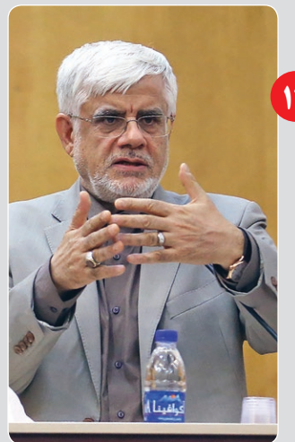
دراکنش به ماجرای دانشگاه شریف عارف: دخالت نهادهای بیرون از دانشگاه باعث شکسته شدن حرمت آن شد

با فروش امتیاز پیام توس، فوتبال خراسان رضوی به مرز ورشکستگی رسیده است