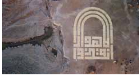
نقاشی‌های دیمین هرست

«دیمین هرست» هنرمند مشهور انگلیسی در یک مراسم آیینی در جدیدترین گالری خود، از ۱۲ اکتبر شروع به سوزاندن ۱۰۰ اثر از اولین مجموعه NFT توکن غیرقابل تعویض) خود کرد. این هنرمند با پوشیدن شلوار و دستکش‌های محافظ نقره‌ای، در حالی که اولین قطعه را در یکی از شش شومینه طراحی شده و سفارشی موجود در گالری می‌سوزاند گفت: «چه روز عجیبی است» این اقدام مرحله نهایی پروژه NFT هرست به نام «پول» است که در ژوئیه ۲۰۲۱ با مجموعه‌ای از ۱۰۰۰ نقاشی نقطه‌ای آغاز کرد و هر کدام با عنوان، شماره‌گذاری، امضا و لینک به NFT مربوطه با قیمت ۲۰۰۰ دلار فروخته شد. سپس خریداران می‌توانستند انتخاب کنند که کار فیزیکی را دریافت کنند یا نقاشی آنالوگ را از بین ببرند. در نهایت ۵۱۴۹ خریدار تصمیم به حفظ آثار هنری فیزیکی گرفتند و ۴۸۵۱ خریدار NFT را انتخاب کردند. نقاشی‌هایی که قرار بود به صورت فیزیکی باقی بمانند از ۶ سیتامبر در گالری خیابان نیویورک به نمایش درآمدند و آثار باقیمانده هر روز تا پایان نمایش در ۳۰ اکتبر به صورت دسته‌ای سوزانده می‌شوند. تصمیم درست برای به آتش کشیدن آثار خود، حمایت نهایی او از NFT را نسبت به اثر هنری فیزیکی تأیید می‌کند. «هرست» پس از اینکه چند اثر را به آتش کشید، اعتراف کرد: «در واقع بیشتر از آنچه فکر می‌کردم از این کار لذت می‌برم». به گزارش هنرآنلاین، او پیش از سوزاندن هر اثر مطمئن می‌شود که شماره و عنوان آن با دقت فیلمبرداری شده است. در مورد تأثیرات زیست محیطی این آتش سوزی‌ها نیز گفته شده است با وجود بود دود چوب در گالری، این اجاق‌های چوب سوز عملا بدون دود هستند و تمام سوخت آن‌ها از منابع تجدیدپذیر تأمین می‌شود.