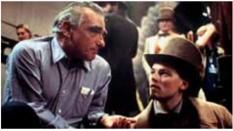
آل پائینو و رابرت دینرو در فیلم «ایریشمن»

«مارتین اسکورسیزی» پس از ساخت فیلم موفق «دار و دسته‌های نیویورکی» در سال ۲۰۰۲ با بازی «لئوناردو دی کاپریو»، «دنیل دی لویس» و «کمون دیاز»، این بار یک سریال را برای شبکه میراکس بر اساس رمان نوشته «هربرت اسپیری» بسازد که علاوه بر تهیه‌کنندگی، کارگردانی او را پیروز اول را بر عهده دارد. «برت لئونارد» نگارش فیلمنامه این سریال را بر عهده دارد که گفته می‌شود برداشت جدیدی از رمان «دار و دسته‌های نیویورکی» با شخصیت‌های جدیدی است که در نسخه سینمایی حضور نداشتند. کتاب «دار و دسته‌های نیویورکی» به جزئیات درگیری میان دار و دسته‌های رقیب در نیویورک در میان‌ها و اواخر سده ۱۸۰۰ میلادی پیش از ظهور و تسلط گروه‌های مافیایی آمریکایی-ایتالیایی در دوره ممنوعیت استفاده از الکل در دهه ۱۹۲۰ میلادی می‌پردازد. فیلم «دار و دسته‌های نیویورکی» در سال ۲۰۰۲ در ۱۰ شاخه از جمله بهترین فیلم، کارگردانی و بازیگری مرد (دنیل دی-لویس) نامزد دریافت جایزه اسکار شد. به گزارش اسپسنا به نقل از ددلاین، جدیدترین مستند ساخته «مارتین اسکورسیزی» با عنوان «بحران شخصیت: تنها یک شب» اخیرا نخستین نمایش جهانی خود را در جشنواره فیلم نیویورک تجربه کرد.