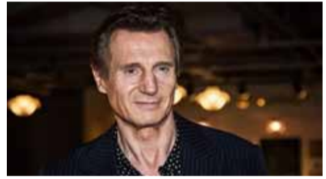
لیام نینسن در فیلم «سلاح عریان»

«لیام نینسن» بازیگر فیلم «سلاح عریان» به کارگردانی «آکیوا شفر» خواهد شد. «ست مک‌فارلین» و «آکیوا شفر» به صورت رسمی از «لیام نینسن» درخواست کرده‌اند تا با بازسازی این فیلم به آنها ملحق شود. بازیگر «بوهده شده» در حال مذاکره است تا بازیگر اصلی نسخه مرنی از این فیلم اسلب‌استیک متعلق به دهه ۱۹۸۰ شود. «شفر» که فیلم‌هایی چون «نجرهای نجات» را در کارنامه دارد، تهیه‌کننده فیلم هم خواهد بود. وی فیلمنامه را با همکاری دن گرگور و داگ ماند نوشته است. «نینسن» اوایل امسال درباره احیای این کم‌دی صحبت کرده و گفته بود پارامونت و مک‌فارلین از وی خواست‌اند به این پروژه بپیوند. این فیلم در اصل فیلم اول یک سه‌گانه است که لژلی نیلسن در آن در نقش فرانکلین در بین یک کارآگاه خوش‌قلب و در عین حال ساده لوح بازی کرده است. به گزارش مهر به نقل از وریٹی، فیلم «سلاح عریان» پرونده‌های جوخه پلیس» محصول ۱۹۸۸ ساخته دیوید راکر فیلمی انتقادی تجاری بود که هم با نقدهای مثبت روبه‌رو شد و هم در گیشه به فروش ۱۴۰ میلیون دلاری دست یافت. موفقیت فیلم موجب شد تا دو دنباله «سلاح عریان یک و نیم» در سال ۱۹۹۱ و «سلاح عریان یک سوم» در سال ۱۹۹۴ ساخته شود.