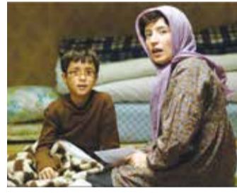
مامان! دیکته سخت بهت نمی‌گم تا نمره بیست بگیری! حوض نقاشی - مازیار میری