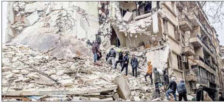
خرابی زمین لرزه ۷/۴ ریشتری سوریه و ترکیه