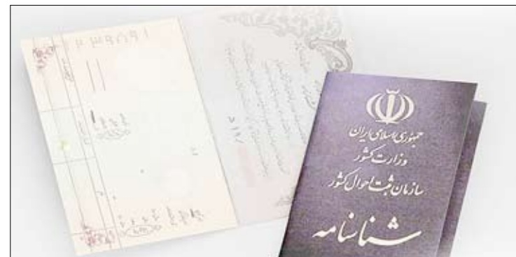
رئیس سازمان ثبت احوال کشور از صدور یک روزه شناسنامه‌های جدید در میز خدمت این سازمان

سازمان در خیابان امام خمینی (ره) برپا شد، درباره ضرورت تمویض شناسنامه‌های قدیمی نیز افزود: تمویض شناسنامه‌ها یکی از برنامه‌های کشور بوده و همه هموطنان باید شناسنامه‌های چاپی جدید دریافت کنند. وی خاطر نشان کرد: برای جلوگیری از جمل و همچنین پایگاه‌های هویتی ثبت احوال شناسنامه‌های جدید را با دقت بیشتری صادر می‌کنند و با تمویض شناسنامه‌ها این پایگاه‌ها از غنای بیشتری برخوردار می‌شوند و سرویس‌های جدید را بهتر ارائه می‌کنند. این موارد لزوم تمویض شناسنامه‌ها را مورد تاکید قرار می‌دهد.