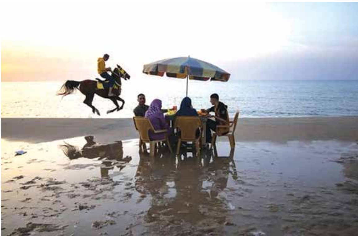
فلسطینی‌ها در ساحل غزه از روز خود لذت می‌برند