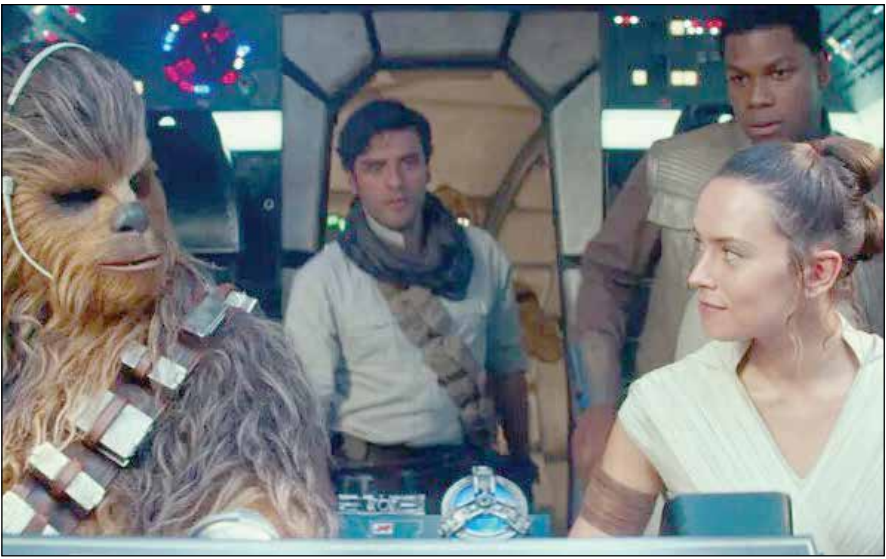
بازیگر و کارگردان فیلم جنگ ستارگان

آن برمی‌خیزند را روایت می‌کند. لوکاس فیلم اخیراً اعلام کرده که «استیون نایت» جایگزین «دیمن لیندلوف» و «جاستین بریت گیبسون» به عنوان نویسندهٔ این فیلم سینمایی شده است. اخیر خیره‌ای زیادی درباره توسعه و ساخت فیلم‌های جدید «جنگ ستارگان» منتشر شده و پروژه‌های جداگانه‌ای تحت نظارت «کوبین فایکی» رئیس استودیو مارول و «پتی جنکینز» کارگردان فیلم «زن شگفت‌انگیز» از مدار تولید کنار گذاشته شده‌اند و پروژه‌های دیگری از