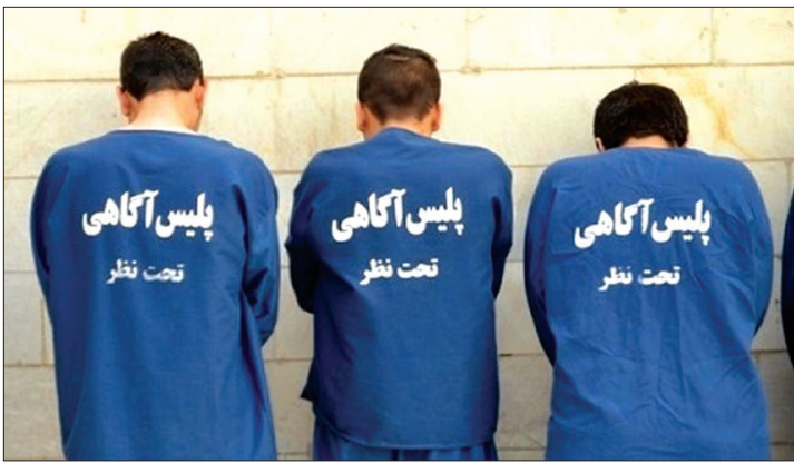
داشت: با اجرای طرح مهار و اعلام مشخصات متهمان به سایر گشت‌های انتظامی، هر ۳ متهم بررسی‌های بیشتر از متهمان ۲ قبضه سلاح