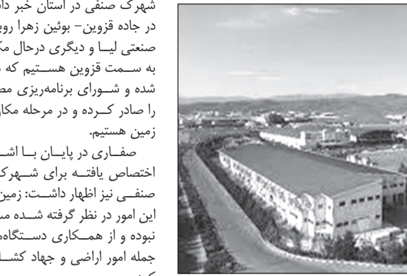
مدیرعامل شرکت شهرک‌های صنعتی استان خراسان:

به محدودیت‌ها در نظر گرفته شد که اولین نقطه در منطقه شمال شهرستان بوئین زهرا مکان یابی شد.