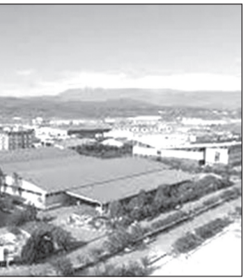
مدیرعامل شرکت شهرک‌های صنعتی استان خراسان:

وی گفت: پیمانکار این طرح انتخاب شد و تا هفته دولت بخش از این طرح به بهره‌برداری می‌رسد.