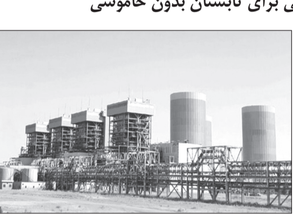
مدیرعامل شرکت شهرک‌های صنعتی استان خراسان: