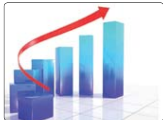
گروه اقتصاد کلان: بر اساس محاسبات مقدماتی

در مقابله نگاهی به ارقام اجزای هزینه‌های (طرف تقاضای اقتصاد) در سال ۱۴۰۱ (به قیمت‌های ثابت سال ۱۳۹۵) نیز نشان می‌دهد که اقلام مصرف خصوصی، صادرات دولتی، تشکیل سرمایه ثابت ناخالصی، صادرات واردات کالاهای و خدمات به ترتیب از نرخ رشدی معادل ۸.۷، ۳.۶، ۰.۳۶، ۰.۲۶ و ۰.۱ درصد برخوردار بوده‌اند؛ این ارقام در سال ۱۴۰۰ به ترتیب معادل ۸.۷، ۳.۶، ۰.۳۶، ۰.۲۶ و ۰.۱ درصد بوده است. لذا می‌توان نتیجه گرفت که در سال ۱۴۰۱ نسبت به سال ۱۴۰۰ میزان مصرف بخش خصوصی به دلیل اجرای سیاست‌های حمایتی دولت و تقویت نسبی قدرت خرید تا حد زیادی بهبود یافته است؛ مصرف واقعی بخش دولتی نسبت به سال ۱۴۰۰ نیز به دلیل اتخاذ مجموعه اقداماتی در راستای صرفه‌جویی در هزینه‌ها و به میزان ملموسی کاهش یافته است و همزمان تشکیل سرمایه ثابت ناخالصی که در سال ۱۴۰۰ با رشد صفر درصدی و در