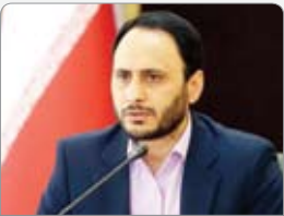
گورد زنی جهم

پلیس فرانسه با مطرح کردن نگرانی‌های امنیتی درباره برگزاری تجمعات سالانه گروهک منافقین، امسال اجازه برگزاری این نشست‌را نداد. خبرگزاری رویترز نوشت، لورنت نوتز، رئیس پلیس پاریس با مطرح کردن نگرانی‌های امنیتی درباره برگزاری تجمعات سالانه گروهک منافقین اجازه برگزاری این تجمع را نداده و نام‌های به کمیته تدارکات برگزاری این تجمعات منافقین اعلام کرد؛ امکان برگزاری این تجمعات که از سال ۲۰۰۸ هر ساله برگزار می‌شود، وجود ندارد. نابر گزارش رویترز، پلیس پاریس در پاسخ به این خبر گزارسی که جوای دلیلی این تصمیم شده بود، در بیانیه‌ای گفت: برگزاری این تجمع می‌تواند با توجه به شرایط ژئوپولیتیکی، موجب ایجاد مزاحمت برای عموم مردم و اخلال در نظم عمومی شود. در این بیانیه آمده است: علاوه بر این، با توجه به این که نمی‌توان خطر حمله تروریستی را نادیده گرفت، برگزاری چنین مراسمی تأمین امنیت آن و امنیت مهمانان مهم آن را به شدت پیچیده کند. رویتز همچنین با ارائه تحلیلی درباره این تصمیم پلیس پاریس مدعی شد که این اقدام در پی تلاش غرب برای کاهش تنش‌ها با ایران انجام شده است که یک نمونه از آن، تبادل اخیر زندانیان میان ایران و کشورهای اروپایی بوده است.