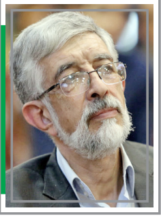
غلامعلی حدادعادل: می‌خواهیم مجلس دوازدهم انقلابی‌تر باشد

آرمان ملی - حمید شجاعی: انتخابات مجلس در پایان سال جاری؛ مشخصاً دوازدهم اسفند ماه برگزار خواهد شد و در همین راستا چندی است که دستگاه‌های اجرائی و نظارتی فعالیت‌های خود را برای برگزاری انتخابات باشکوه آغاز کرده‌اند. این در حالی است که در همین راستا برخی جریانات سیاسی نیز کم‌کم در حال چیش پایه‌های ابتدایی حضور و فعالیت در انتخابات پیش‌رو هستند. چه اینکه مجموعه‌های مختلف در اردوگاه اصولگرایان از شورای وحدت گرفته تا شورای ائتلاف نیروهای انقلاب جلسات خود را برای برنامه‌ریزی در جهت حضور در انتخابات اسفند تحت عناوین مختلف برگزار می‌کنند تا در نهایت در این انتخابات نیز مثل دور گذشته انتخابات مجلس در اسفند ۹۸ بتوانند با وحدتی هر چند حداقلی لیستی واحد ارائه دهند و بر همان مبنای بتوانند در انتخابات بدون شکست و افتراق شرکت کنند. این در وضعیتی است که به نظر می‌رسد شرایط آن طور که باید و شاید برای اینها فراهم نیست و حداقل اختلافات درون جریانی با برجاست. چه اینکه جبهه پایداری نخستین مجموعه‌ای است که به احتمال فراوان اگر خواسته‌هایش از سوی شورای ائتلاف و وحدت اجابت نشود، داد جلدی سر خواهد داد و مستقلان در انتخابات شرکت خواهد کرد. چنانکه اخیراً محمدرضا باهنر، رئیس جبهه پیروان خط امام و رهبری در این خصوص گفته: «۵۶ فهرست می‌خواهد در تهران ارائه شود. باید تلاش کنیم هر کدام اینها قدری از ایده‌آل‌های‌شان کوتاه بیایند تا به یک فهرست ۲۰ نفره برسند.