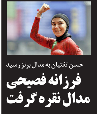
حسن تفتیان به مدال برنز رسید

فرزانه فصیحی و حسن تفتیان در فینال دوی ۱۰۰ متر قهرمانی آسیا به ترتیب مدال نقره و برنز کسب کردند. به گزارش مهر، بیست و پنجمین دوره مسابقات دوومیدانی قهرمانی بزرگسالان آسیا از روز چهارشنبه ۲۱ تیرماه در بانکوک تایلند آغاز شده و تا ۲۵ تیر ادامه خواهد داشت. در ادامه سومین روز از این رقابت ها، عصر امروز جمعه ۲۳ تیرماه سه نماینده کشورمان که جواز حضور در مرحله فینال را کسب کرده بودند به مصاف رقیب رفتند. در جریان برگزاری مرحله نهایی رقابت