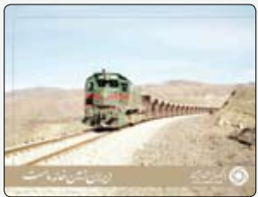
بیش از دو دهه است که هموطنان استان خراسان جنوبی انتظار راه اندازی و بهره

سقف انتقال وجه بین بانکی پایا از طریق درگاه‌های بانک تجارت به ازای هر دستور پرداخت، یک میلیارد ریال شد. به گزارش مدیریت روابطعمومی و ارتقاء سرمایه اجتماعی بانک تجارت، سقف انتقال وجه بین بانکی پایا از طریق بانکداری اینترنتی (IB) و فر (CB) از پانصد میلیون ریال به ازای هر دستور پرداخت به یک میلیارد ریال افزایش یافت.