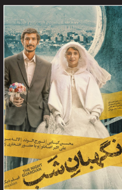
معاون امور بین الملل بنیاد سینمایی فارابی تشریح کرد: