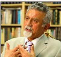
آبروسوز سیدحسن امین

جهان اسلام مانند علامه اقبال لاچوری سال‌ها قبل به شعر و نثر هشدار داده‌اند که تقلید ظواهر و مظاهر زندگی غربی‌ها مثلاً در پوشش و آرایش با سبک معماری، بی‌فایده است و آن چه اسباب ترقی و تعالی جامعه می‌شود، تولید علم و فناوری و اجتماعی پربادام است: