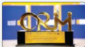
تندیس دهمین اجلاس سراسری «رضایتمندی مشتری» با رویکرد تجلیل

با حضور رئیس جمهوری، آزاد راه چهار فصل شیراز-اصفهان به عنوان یکی از زیباترین جاده های کشور به بهره برداری رسیده گزارش روابط عمومی بانک ایران زمین، با اعلام معاون وزیر راه و شهرسازی با افتتاح این بزرگراه ۹ درصد به طول آزاد راههای کشور افزوده شده است. مدیرعامل بانک ایران زمین در رابطه با مشارکت این بانک در این پروژه بزرگ گفت: یکی از اهداف بانک ایران زمین مشارکت در پروژه های ملی و اقتصادی بزرگ کشور است، تا از این طریق نقشی در رشد اقتصاد کشور داشته باشد. افزود: پروژه آزاد راه شیراز-اصفهان یکی از طرح هایی است که می تواند موجبات توسعه اقتصادی از طریق اتصال شمال به جنوب کشور (دریا به دریا)، بهبود شرایط حمل و نقل، امنیت جاده ای، کاهش زمان، کاهش مصرف سوخت، رشد گردشگری و... را فراهم کند.