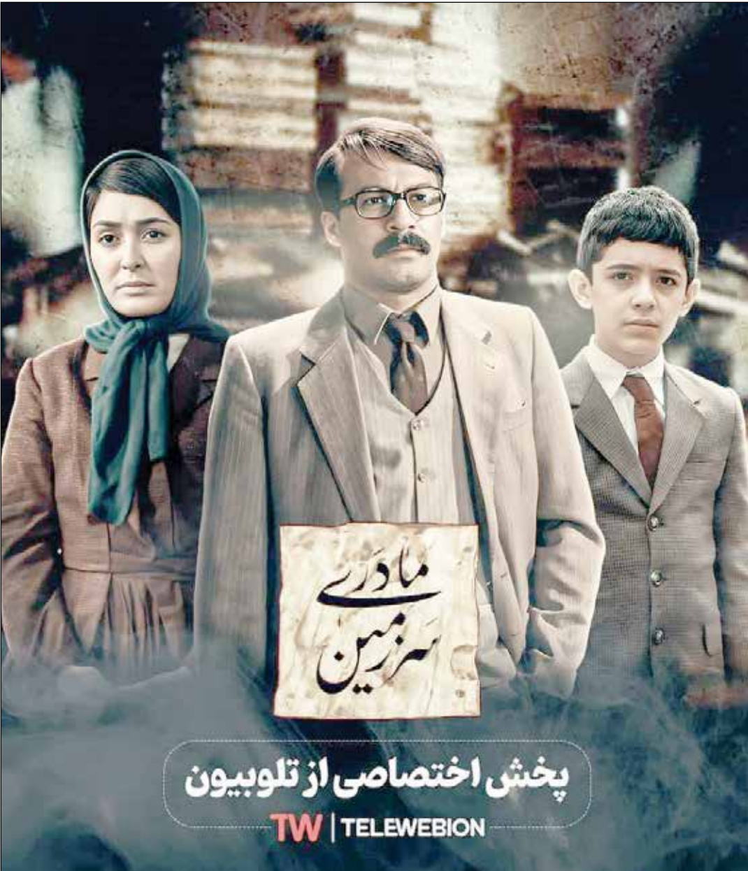
بازیگران سریال «سرزمین مادری» در صحنه‌ای از فیلم.

طسی یکی – دو دهه اخیر بوده است که بسیاری منتظر حل مشکل و تماشای آن بودند. یکی از نکات جالب توجه درباره این سریال، فهرست بازیگران پر تعداد آن است؛ هنرمندانی که اغلب در بسازه‌ی زمانی ۱۰ ساله بین تولید و پخش، زمانی در جایگاه متفاوتی به لحاظ حرفه‌ای بوده‌اند و حالا در