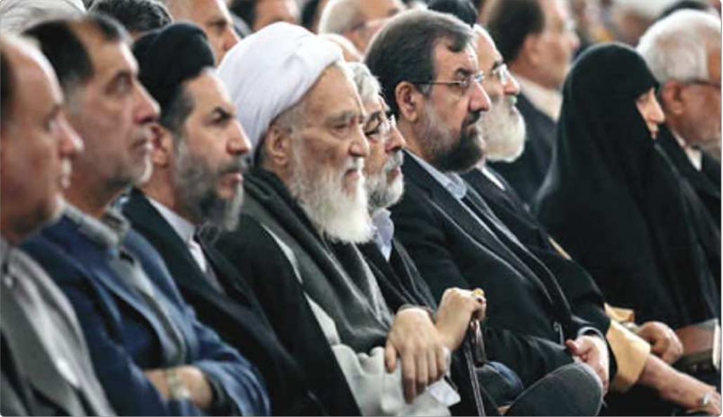
سید علی خامنه‌ای در جریان نشست خبری.

دیگر برگزار می‌شود، علاوه‌بر رقابت آن ۳ طیف اصولگرا، چندین و چند طیف دیگر نیز از آنان اشباع کرده و رودرروی همفکران قدیمی‌شان ایستاده‌اند. به بیان دقیق‌تر در شرایطی که در انتخابات اسفندماه ۹۸، پس از جلسات متعددی که شورای ائتلاف نیروهای انقلاب که توسط چه‌رهایی چون حداد عادل و قالیباف مدیریت می‌شد و شورای وحدت که حول محور جامعه روحانیت مبارز و ابراهیم ربیعی جمع شده بودند و البته جبهه پایداری با نقش‌آفرینی چه‌رهایی چون صادق محصولی و مرتضی آقاچه‌رانی مثلث اصلی رقابت انتخاباتی را تشکیل داده بودند، اکنون علاوه‌بر آن ۳ نهاد اصولگرا، ۴، ۳ طیف کنونی مجلس نیز به‌نجوی دیگر همین دیدگاه‌را مطرح کرده و گفته: «در مجلس دوازدهم ممکن است به لحاظ گفت‌مانی مجلس یازدهم تکرار شود»، احمد نادری اما در شرایطی از احتمال تکرار گفتمانی سخن گفته که او به‌عنوان یکی از مهم‌ترین نمایندگان نزدیک به رییس مجلس انقلابی، حال که به انتخابات مجلس دوازدهم نزدیک شده‌ایم، همچون بسیاری از اصولگرایان، ساز جدایی از شورای ائتلاف کوک کرده و می‌خواهد با فهرستی موسوم به «حجاران» با دیگر لیست‌های اصولگرا و انقلابی در انتخابات پیش‌رو رقابت کند. آن هم در شرایطی که پس از اعلام موجودیت اصولگرایان تحت عنوانی گوناگونی همچون «ائتلاف»، «وحدت»، «پایداری»، «شریان»، «مانا»، «حجاران» و حتی «صبح ایران» و احتمالا «مولف»ه، اخیرا هفته‌نامه «د» ۹۷ به مدیریت حمید رسایی نیز اقدام به انتشار فهرست انتخاباتی کرده‌است. جاییه صبح ایران» حتی چه‌ره‌های قدیمی‌تر و باتجربه‌تر جریان اصولگرایی نیز حاضر به انکار و تکذیب این تشتت درون گفتمانی اصولگرایان نیستند. حتی دبیر کل حزب مولف»ه اسلامی نیز دیروز در سخنانی در وزارت کشور، قول دولت انقلابی بود، برخوردار