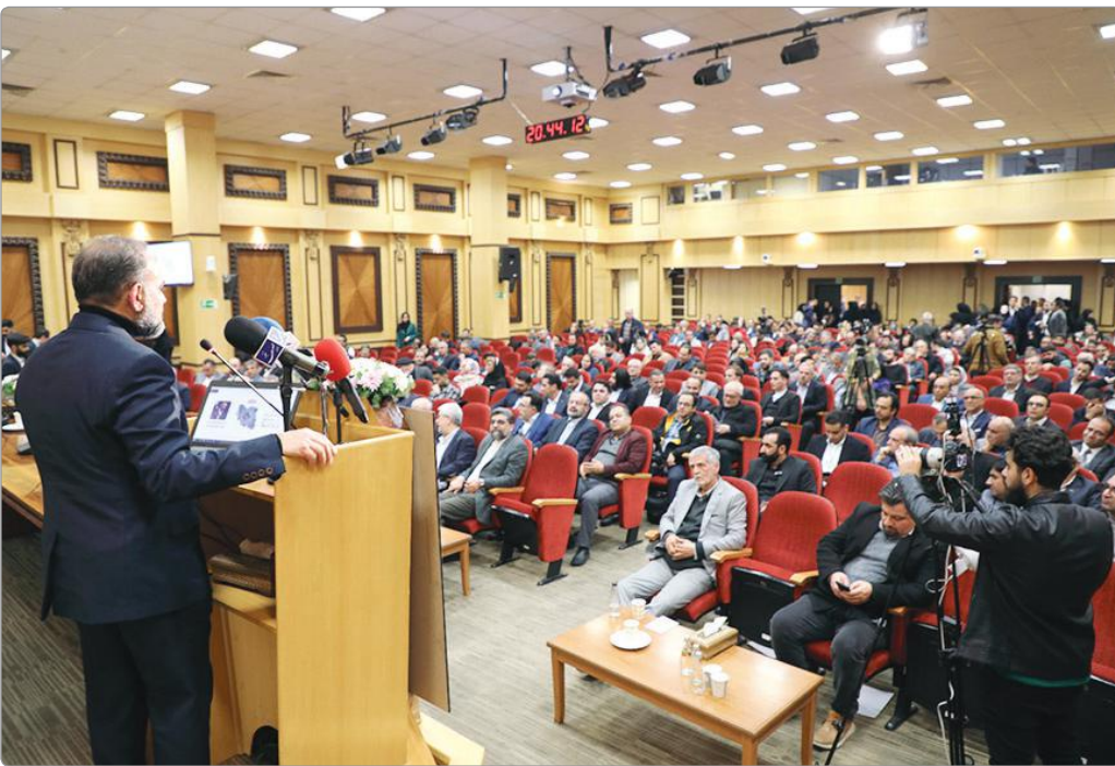
گزارش: سیدرضا فرزین

«جهان صنعت» - بیست‌ویکمین دوره جشنواره تولید ملی - افتخار ملی با حضور مسوولان دولتی و بخش خصوصی با هدف بررسی چالش‌ها و ارائه راهکارهای مناسب در جهت تقویت تولید داخلی و رفع موانع تولید برگزار شد.