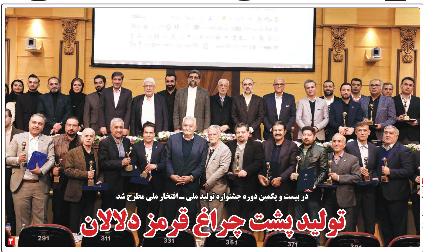
در بیست و یکمین دوره جشنواره تولید ملی - افتخار ملی مطرح شد