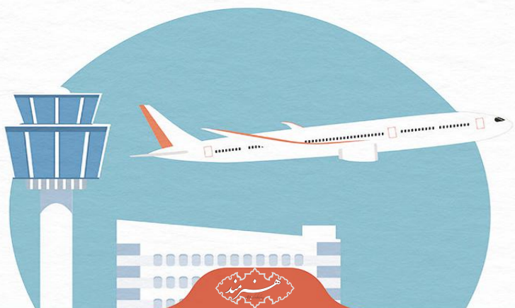
گرافیک: نگین نصراللهی